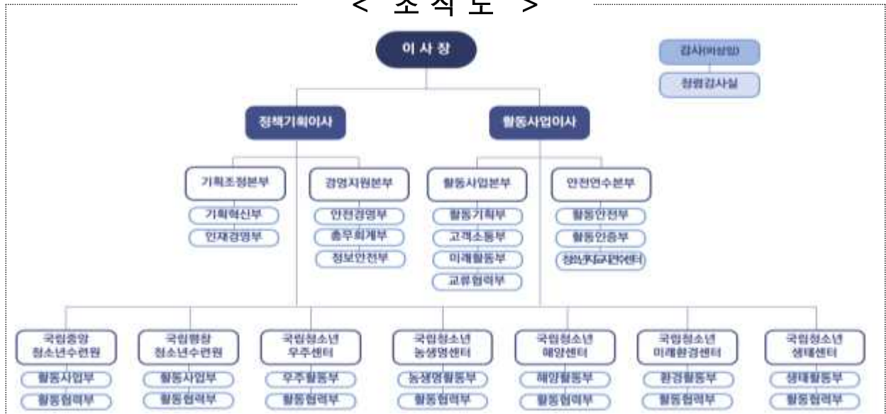
< 조직도 >