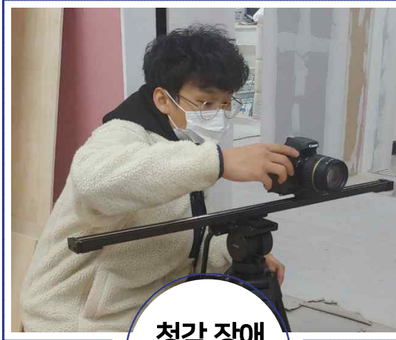
청각 장애 청소년